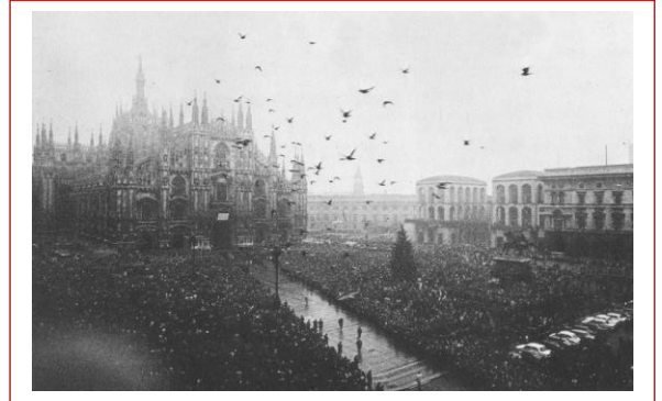
Piazza Duomo il giorno dei funerali delle vittime

Per approfondire: https://it.wikipedia.org/wiki/Strage_di_piazza_Fontana